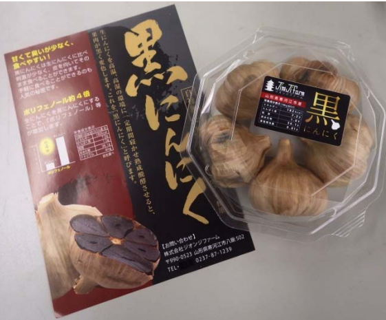
ジオンジファームの黒ニンニク

荒廃農地とは、耕作の放棄によって、通常の農作業では作物の栽培ができなくなった農地のことだ。荒廃農地はそのまま放置しておく、病害虫の発生や獣の住みかになって周辺の農地に悪影響を与えてしまう。今回はそんな荒廃農地を再生してできた新たな食を紹介したい。