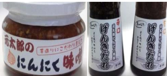
ニンニクを使用した製品

ニンニクで元氣モリモリ! 寒河江市の慈恩寺地区では、平成22年〜平成24年にかけて、荒廃農地を再生しニンニクを栽培している。国内で流通しているニンニクは輸入品が多く、安心・安全なニンニクを食卓へ届けたいとの思いで、寒河江市の「(株)ジオンジファーム」(平成23年設立)が始めたものだ。収穫したニンニクは黒ニンニクとして加工販売しているほか、ニンニク味噌やニンニクだれとしての製品化もしている。栄養満点で疲労回復効果の効果もあるニンニクをぜひみなさんもお試しあれ。