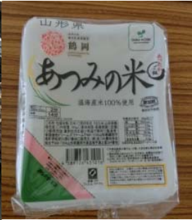
パックライス「あつみの米」