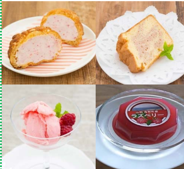
ラズベリーを使ったお菓子

ラズベリーの栽培は、国内でも珍しく、収穫されたラズベリーは舟形町にある「(株)舟形町地域振興公社(舟形若あゆ温泉)」に出荷し、シフォンケーキやゼリーなど、ラズベリーの甘酸っぱさの特徴を活かした商品として販売している。