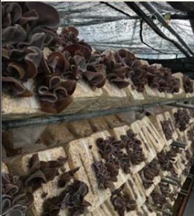
きくらげの菌床栽培