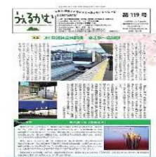
（情報誌「うえるかむ」）