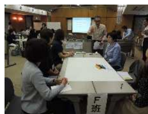
（支援者意見交換会）