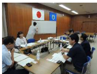
（個別支援計画検討会）