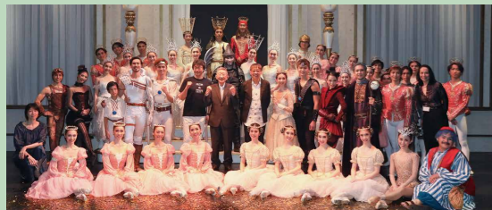
2020年公演より。中央がすぎやまこういち氏。その左がドラゴンクエスト原作の堀井雄二氏、右がバレエ演出を手がけた鈴木稔氏。

1986年に発売されて以来、ファンファーレで始まるあの音楽とともに、世界中で高い人気を誇る『ドラゴンクエスト』とスターダンサーズ・バレエ団の奇跡のコラボレーション。さらに、山形交響楽団の生演奏というとびきり贅沢な公演です。舞台からほとぼるエネルギーを感じてください!