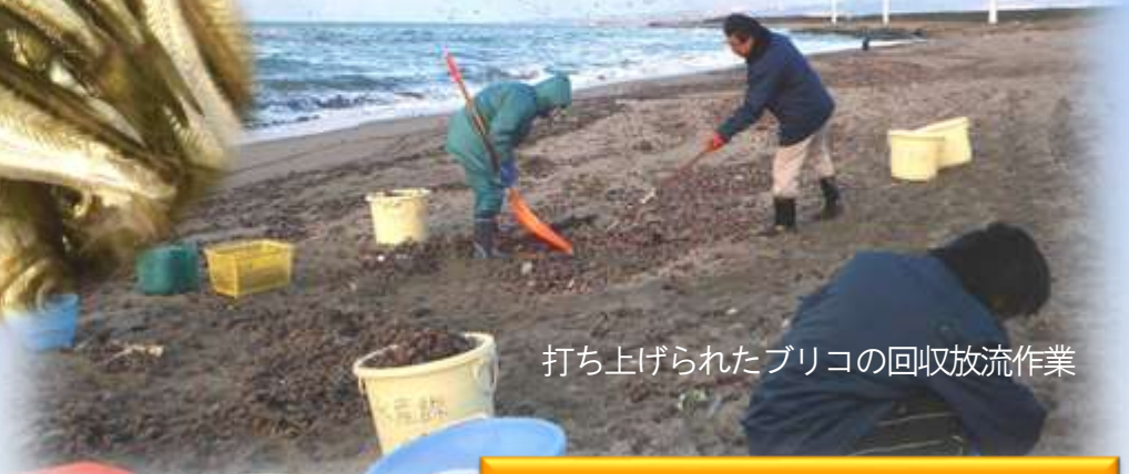
打ち上げられたブリコの回収放流作業