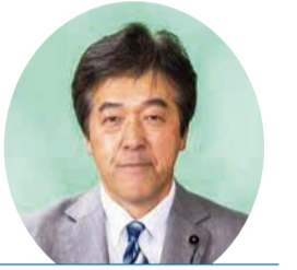
日本共産党山形県議団 関 徹 議員 (鶴岡市選挙区)