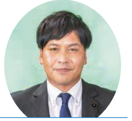
自由民主党 鈴木 学 議員 (東村山郡選挙区)