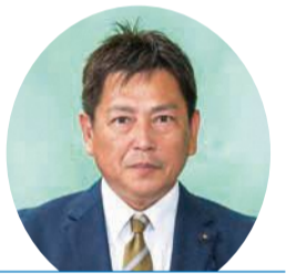
県政クラブ 高橋 淳 議員 (鶴岡市選挙区)