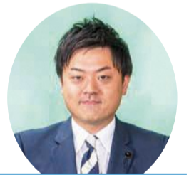
自由民主党 阿部 恭平 議員 (寒河江市・西村山郡選挙区)