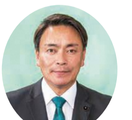
自由民主党 相田日出夫 議員 (東置賜郡選挙区)

各学校では、研修や校内委員会を開催し、障がいのある子ども一人ひとりの支援内容を検討・共有しながら、学校全体で児童生徒に寄り添い、対応に当たっている。このため、教職員の資質や学校の対応力向上に資する研修の実施や具体的な支援方法に係る情報発信に取り組んでおり、今後も研修内容の充実や新たなICT技術活用の研究に努め、教職員の理解促進と指導力向上を図っていく。