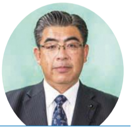
自由民主党 加賀 正和 議員 (尾花沢市・北村山郡選挙区)