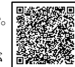
県ホームページへ