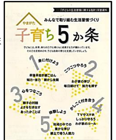
やまがた子育て5か条リーフレット

子どもと一緒に書き込みながら活用でき、子どもの主体的な学びにつながる家庭学習・生活習慣づくりを提案しています。