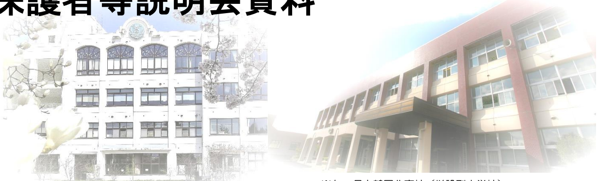
※左 県立鶴岡北高校（併設型中学校） ※右 県立鶴岡南高校（併設型高校）