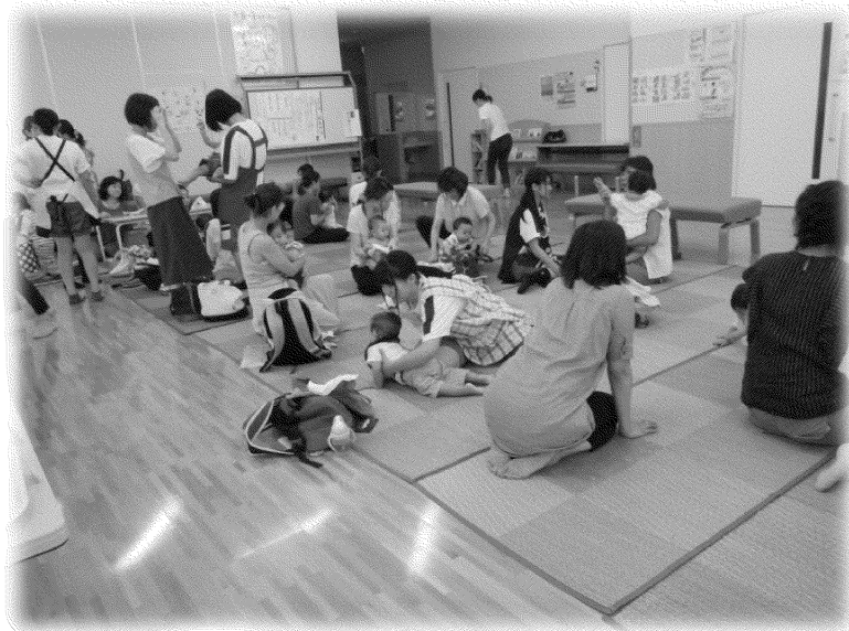
～ふれあい体験学習～

天童市では、未来の子育てを担う高校生に、この「ふれあい体験学習」とおして、子育てといのちの大切さを考える機会を提供するとともに、安心して妊娠・出産・育児のできる優しい街づくりを目指していきます。