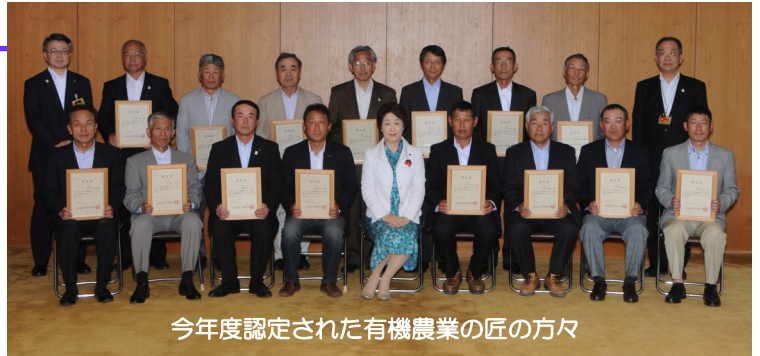
今年度認定された有機農業の匠の方々

有機農業の匠の役割は、これまで培った知識、経験、技術を活かし、新しく有機農業を始める方へ栽培技術や経営等について、指導や助言を行うことです。また、研修会の講師、研修の受け入れ等も行います。有機農業の匠による新規取組者への支援により、有機農業者の定着が期待されます。