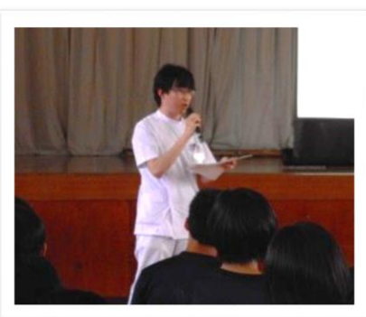
薬剤師による講話