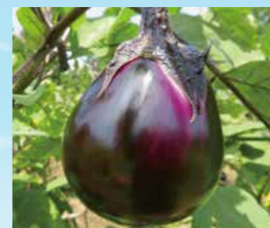
最上伝承野菜「畑なす」(新庄市) 収穫時期7月中旬～9月下旬

食では、山菜やそば、伝承野菜が有名です。肘折・赤倉・瀬見などの温泉、義経や芭蕉ゆかりの地、最上川峡の絶景、金山町の美しい街並みなど豊かな観光資源にも恵まれています。