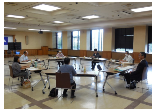
● 山形の良さとその楽しみ方について 意見を交わす委員のみなさん