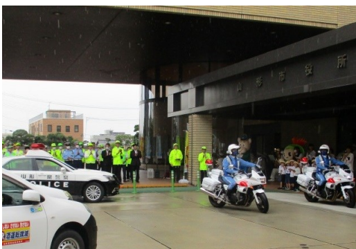
● 9/21 『秋の交通安全県民運動』出発式 （会場：山形市役所）

村山地区交通安全対策協議会（事務局：村山総合支庁）は、9月21日（木）、山形市交通安全推進協議会（事務局：山形市）との共催により、『秋の交通安全県民運動』出発式を実施しました。