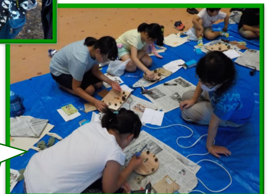
● 木育プログラム「時計」づくり