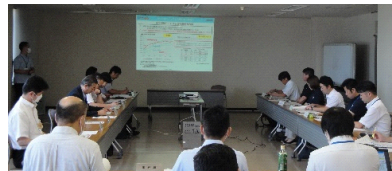
● 8/9「やまがた蔵王自転車活用推進協議会」