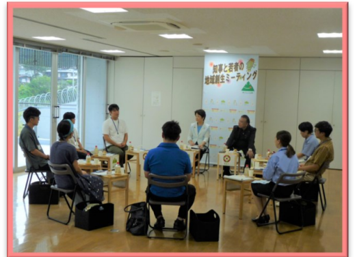
● 活気に溢れたミーティング