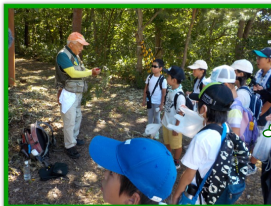
● 森林インストラクターと一緒に森林散策