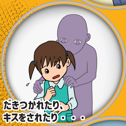
だきつかれたり、 キスをされたり・・・