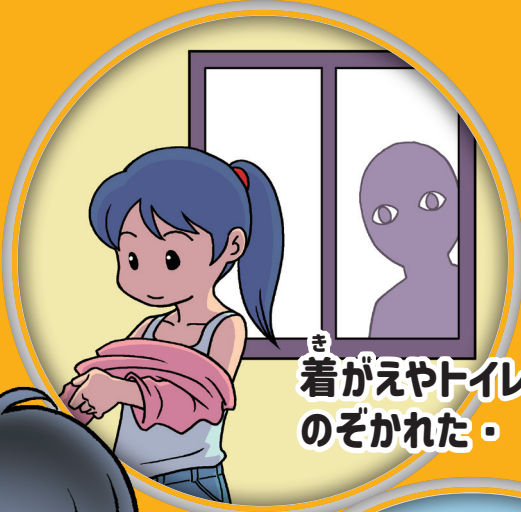
着がえやトイレを のぞかれた・・・