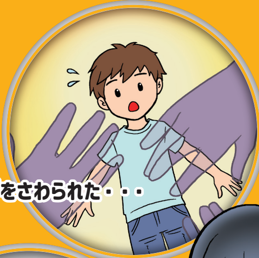
カラダをさわられた・・・