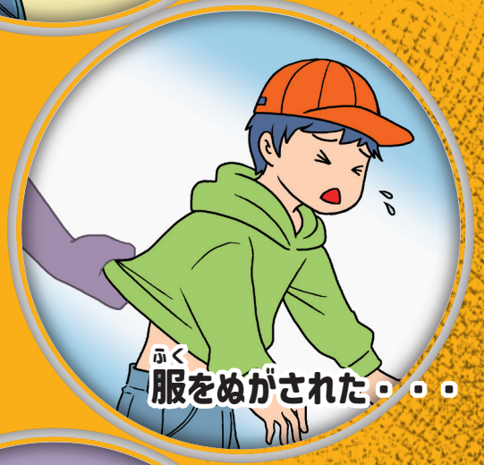
ふく 服をめぐされた・・・