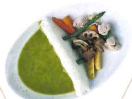
最上小国川流水型ダムをイメージした『ダムカレー』!!