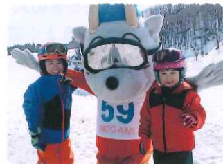
赤倉温泉スキー場 12/21(土)フルオープン!!