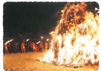
第50回 赤倉温泉お柴灯まつり 開催日 1/11(土)18:00~ 赤倉温泉の冬の風物詩