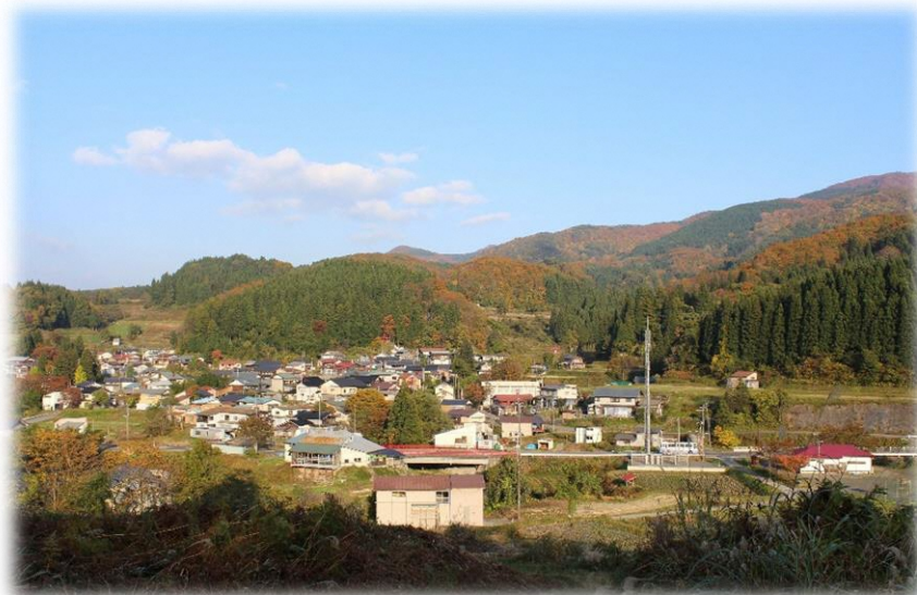
越沢地区（イメージ）

農林水産省と公益財団法人日本農林漁業振興会が共催で実施している「豊かなむらづくり全国表彰事業」において、令和5年度内閣総理大臣賞を受賞した「越沢自治会」にて農村交流会を行います。