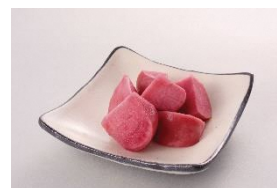
焼畑あつみかぶ漬物（イメージ）

江戸時代からこの地を代表する特産物の「焼畑あつみかぶ」を使った漬物作り体験。名人がこっそり教える特別レシピに沿って、漬物作りを体験していただきます。