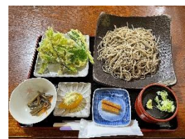
季節の天ぷらと越沢三角そば（イメージ）

越沢集落で昔から受け継がれてきた在来作物「越沢三角そば」は自然薯をつなぎに打ったそばで、ナッツのような豊かな香りと抜群の喉ごしが特長です。ここでしか味わえない「越沢三角そば」をご賞味いただき、農村の方々との交流をお楽しみください。