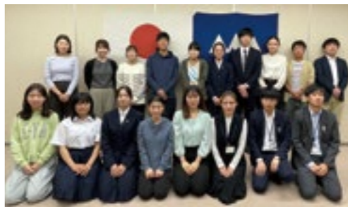
今年度はこのメンバーで活動!