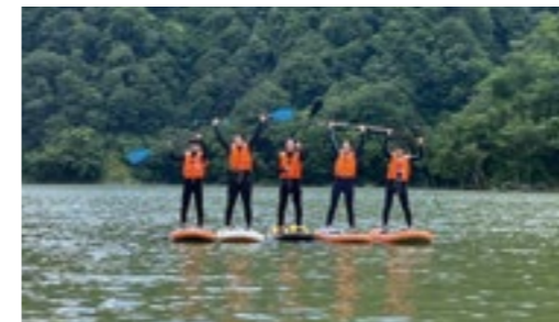
ながい百秋湖でのSUP体験