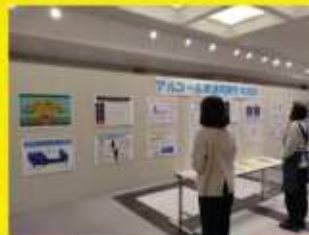
飯豊町町民総合センター

最上総合支庁(新庄市) 11月 5日(火)～11月15日(金) 県立新庄病院(新庄市) 11月 1日(金)～11月29日(金) (図書館/デジタルサイネージによる掲示)