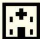
依存症専門 医療機関