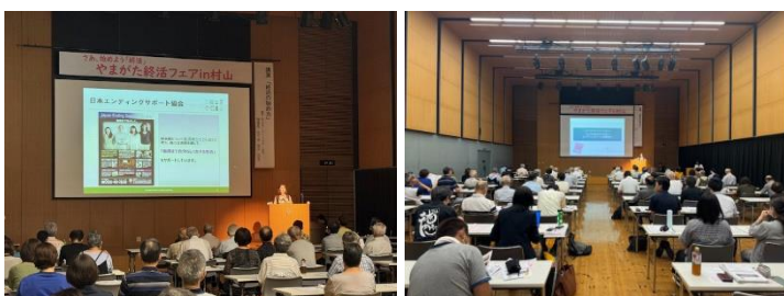
今年7月に村山市で開催した様子

（本フェアは、山形県とあいおいニッセイ同和損害保険株式会社のやまがた創生に関する連携協定の一環として共同で開催するものです。）