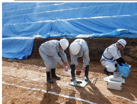
現場密度試験 (R5実施)