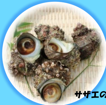
サザエのつぼ焼き