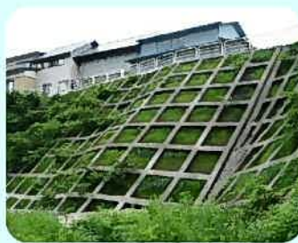
がけ崩れ対策 (のり枠)