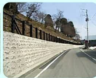
がけ崩れ対策 (よう壁)