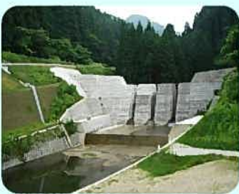
土石流対策 (砂防えん堤)