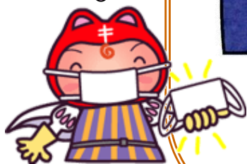
結核予防会キャラクター 「シールぼうや」