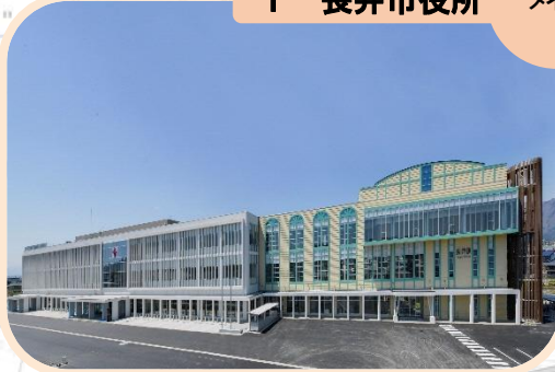
1 長井市役所 メイン