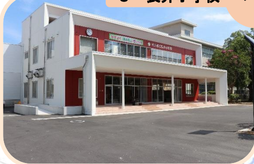
3 長井小学校 メイン