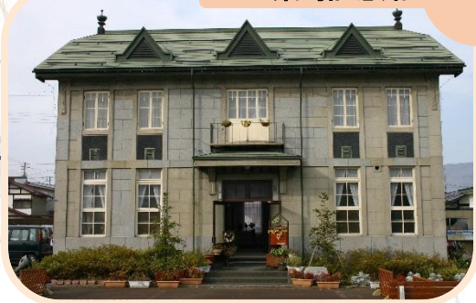
2 桑島記念館 メイン