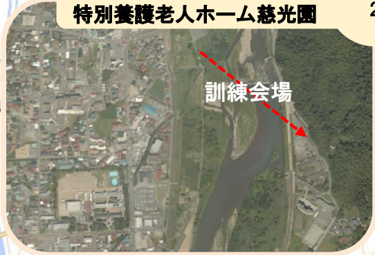
最上川フットパス～ 特別養護老人ホーム慈光園 サブ 2