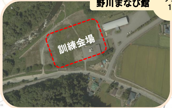
野川まなび館 サブ 1