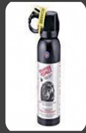
クマ撃退スプレー

④ 万一、クマに出合ったら、背を向けずに、ゆっくり後退してください。(クマ撃退スプレーの使用も有効です。)