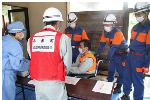
総合防災訓練の実施