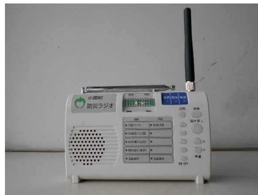
全戸配布の防災ラジオ