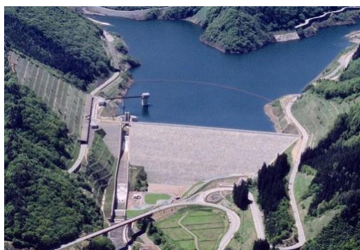
今回渇水対応を行った 綱木川ダム