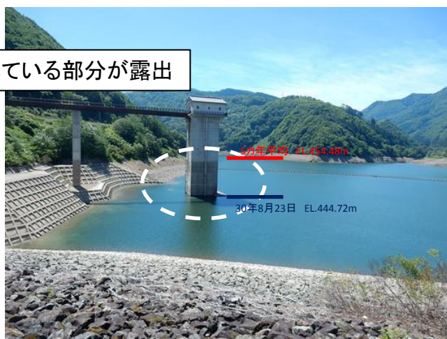
【渇水時：平成30年8月23日状況】