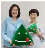
移住相談スタッフ (移住コンシェルジュ)