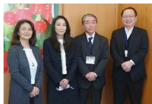
就職相談スタッフ (人材確保コーディネーター、 産業情報発信・就業相談員)