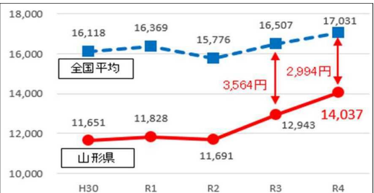
【平均工賃月額推移（過去5か年度）】

障がい者就労継続支援B型事業所の活動に対する企業の理解と協力を得ながら、 事業所の受注機会の確保・拡大 や事業所製品の開発・改良等に対する支援などにより、事業所の売上を伸ばして利用者の 工賃向上を実現 する。