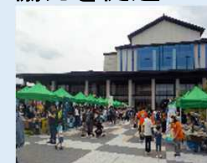
事業所商品販売会