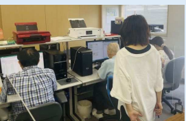
PCを使ったデジタル関連業務