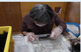
細かな部品の組立業務