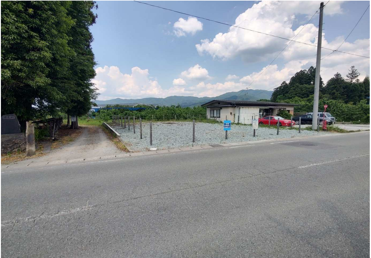
土地の北西側から南東方向を撮影