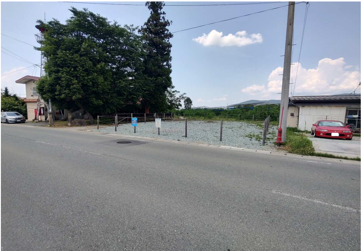
土地の南側より北方向を撮影