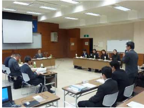
山形県公共事業評価監視委員会の状況