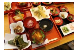
山菜御膳 (イメージ)