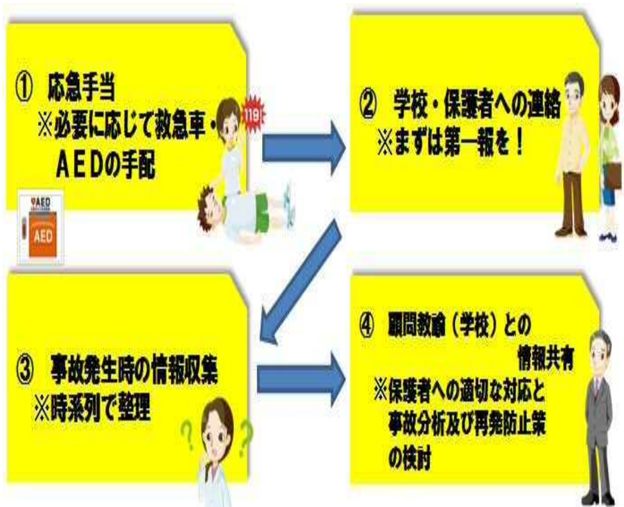
(参照1) 事故発生時の連絡体制