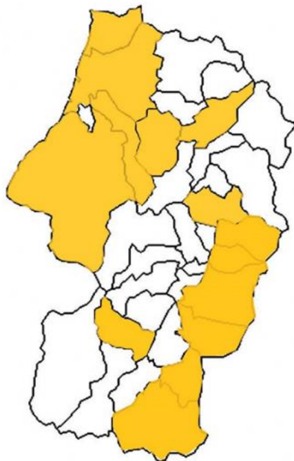
図2 日本語教室設置市町村