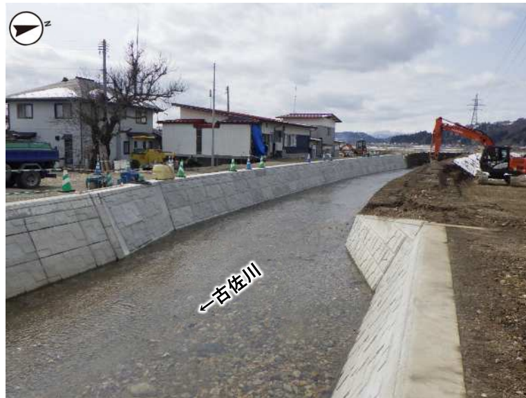
河川整備状況（R6.2月撮影）