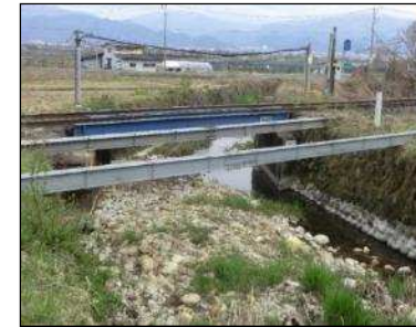
J R 左沢線橋梁付近