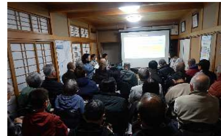
事業説明会 (令和5年12月)