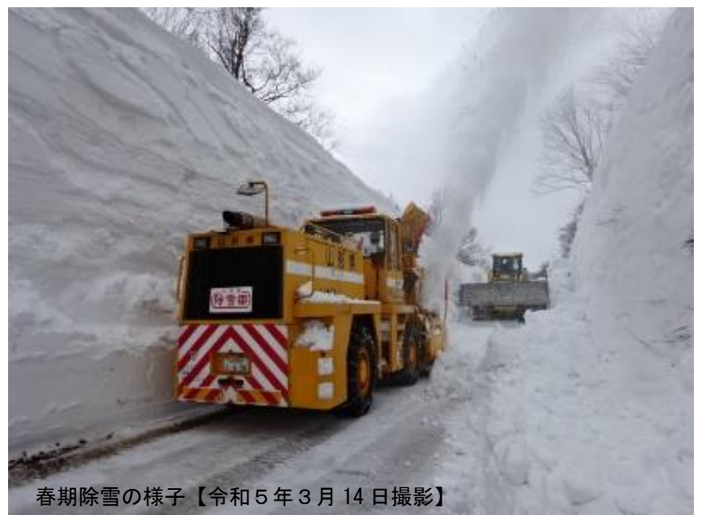
春期除雪の様子【令和5年3月14日撮影】