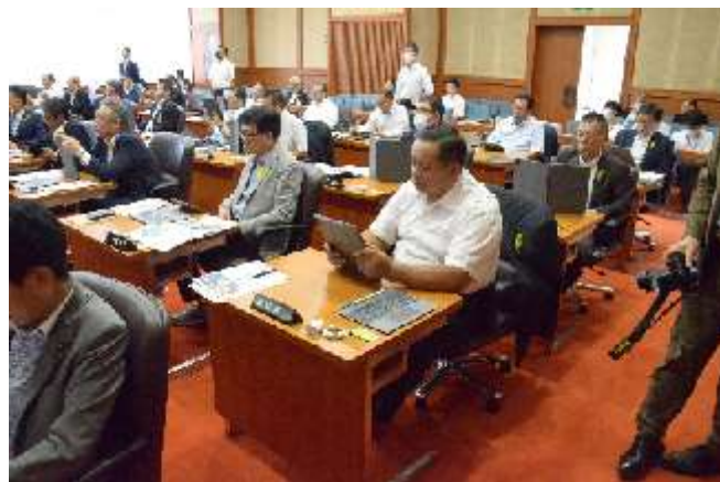
【R5. 9. 22 開催 ペーパーレス会議システムの操作に係る研修会】