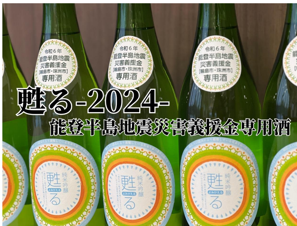
純米吟醸甦る 能登半島地震復興支援試飲会(長井市)