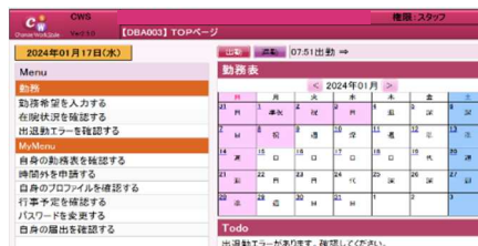
勤務管理システム画面イメージ

医師の時間外労働の上限規制等への対応のため、職員の正確な出退勤時間を把握する勤務管理システムを本格的に運用。