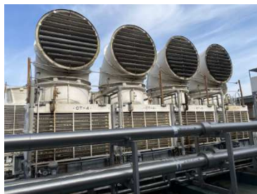
中央病院 冷却塔 (現状)