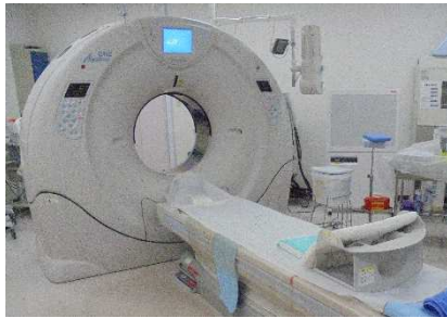
河北病院 CT (現状)