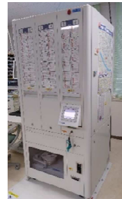
こころの医療センター 全自動錠剤分包機 (現状)