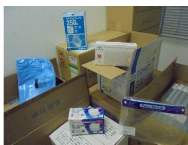
感染防護具の備蓄状況