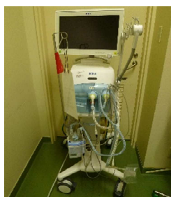
感染症対応医療機器の更新 中央病院 新生児用 人工呼吸器（現状）

新興感染症等に係る医療を提供する体制の確保に必要な措置を迅速かつ的確に講ずるため、感染症対応医療機器を整備するとともに個人防護具を備蓄。