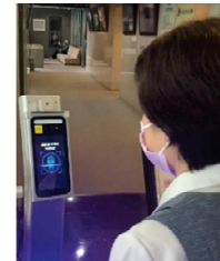
顔認証付き打刻機