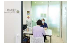
新庄病院 総合患者サポートセンター