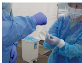
新型コロナ流行時の検査対応