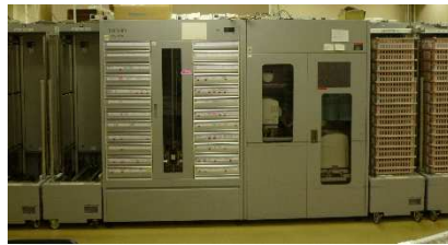
中央病院 注射薬払出装置 (現状)