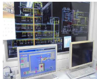
河北病院 中央監視装置 (現状)