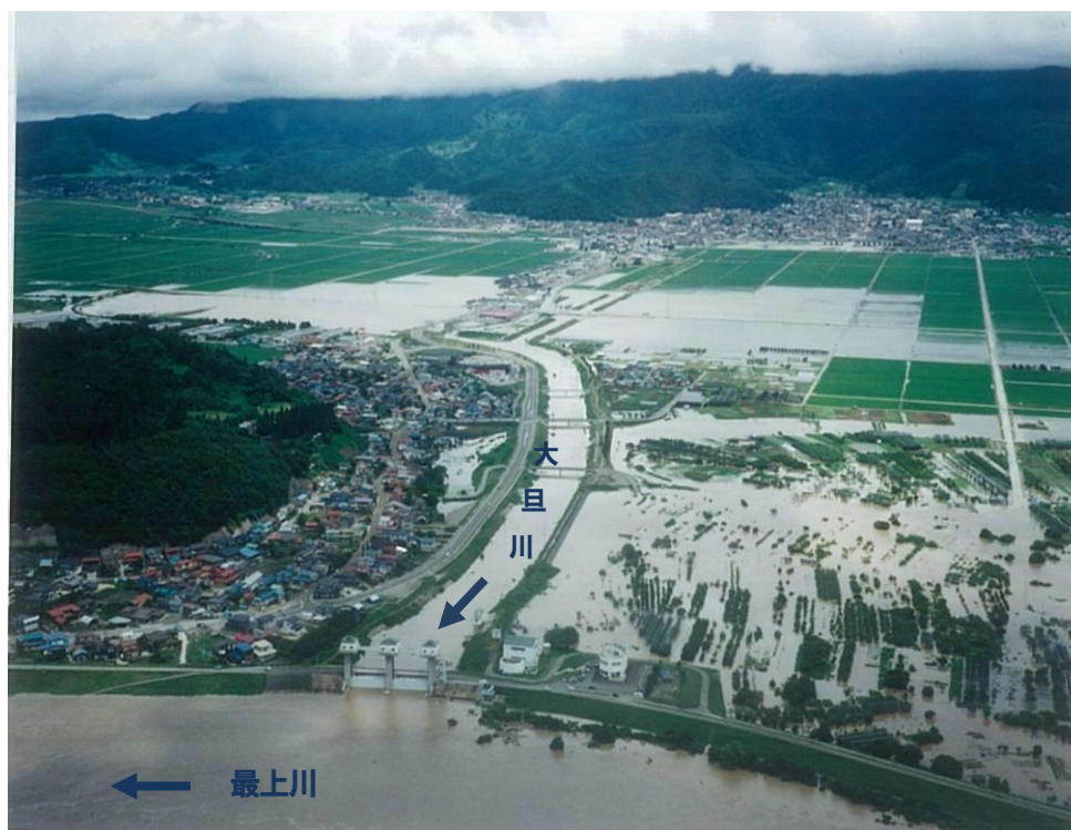
一級河川大旦川（平成14年7月浸水被害状況）

大旦川（村山市）において、河道改修と併せて計画目標相当の洪水を安全に流下させるため調整池を計画し抜本的な治水安全度の向上を図る。