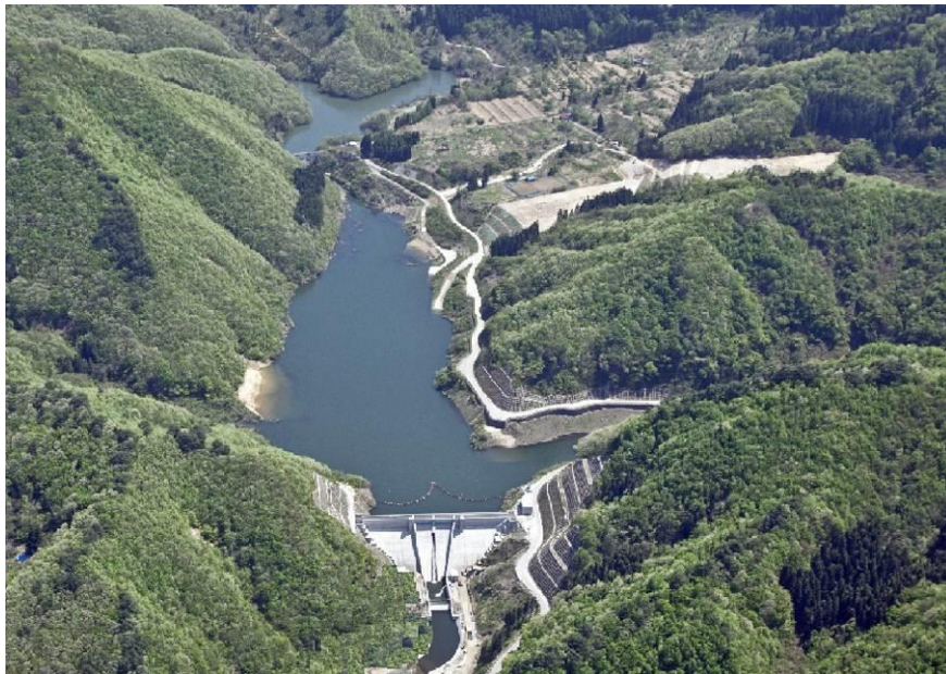
留山川ダム（平成23年7月竣工）

また、平成20年度に最上小国川流水型ダム（最上町）の建設事業に着手し、今年度に完成する予定である。