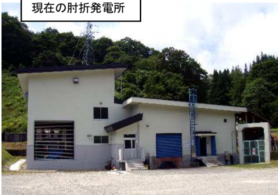
現在の肘折発電所