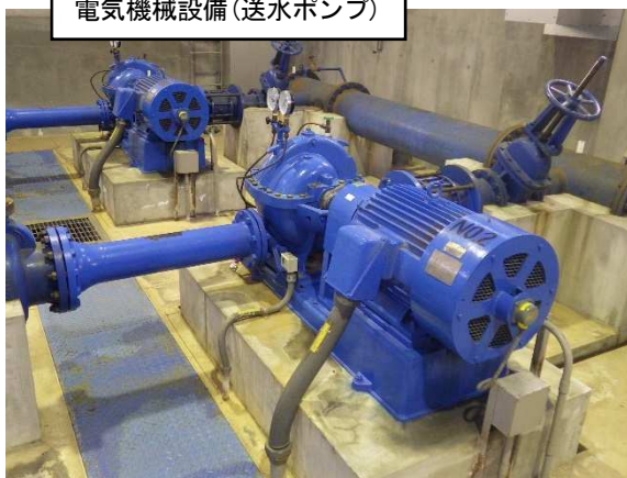
電気機械設備(送水ポンプ)