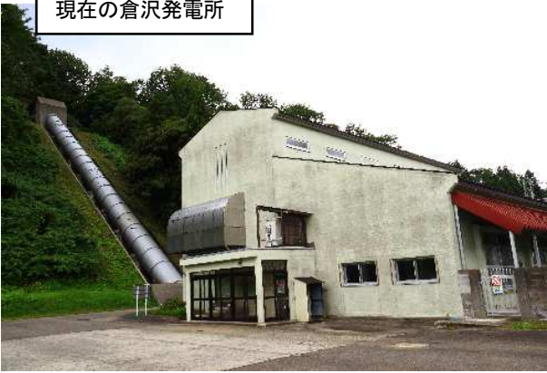
現在の倉沢発電所