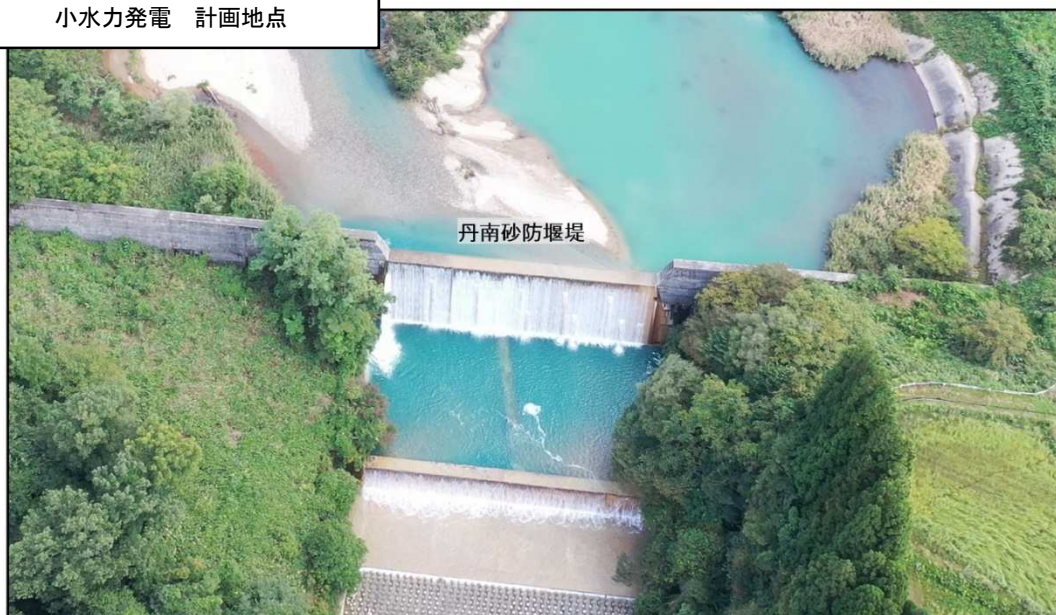
小水力発電 計画地点