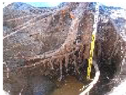
写真1 地下水層で発達が制限されている根系