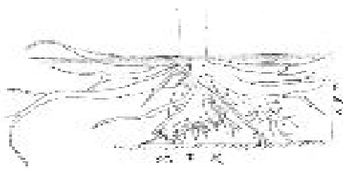
図2 残存立木(左)と根返り木(右)の根系