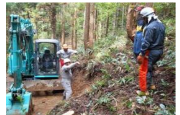
技術力の向上 (森林作業道の作設)