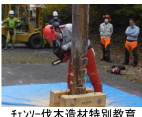
チェーンソー伐木造材特別教育