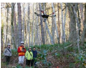
スマート林業技術研修