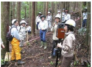
地上レーザ測量研修