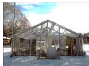
環境制御育苗施設