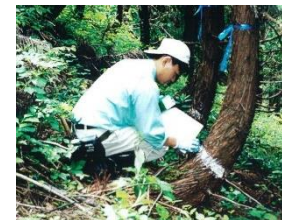
クマ剥ぎの防止技術