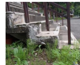
コンクリートの劣化と手摺腐食 (林木育種園管理棟入口)