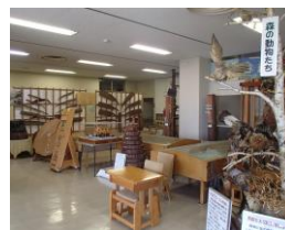
研修館展示スペース