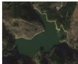
西川町沼山の試験実習林 (総面積59.6ha)