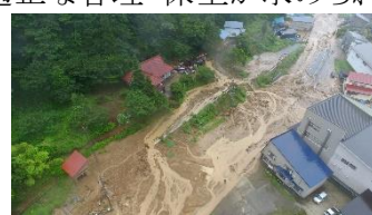
大雨による被害状況