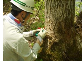
ナラ枯れの防除技術