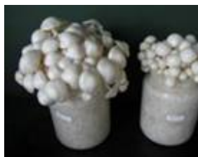
白色ナメコの開発