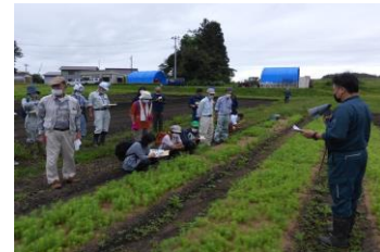
研究成果の技術指導 (優良品種の育苗)

方向②: 地域林業の推進役となる人材の育成 ○森林施業プランナーや林業機械オペレーター等を対象とした研修の強化 ○市町村職員等を対象としたICT技術や新たな林業技術の習得などスキルアップ研修等の強化