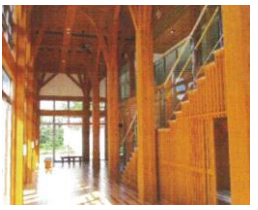
隣県研究機関 (宮城県林業技術総合センター)