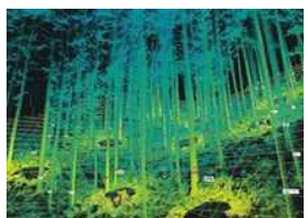
地上レーザ測量による3D化