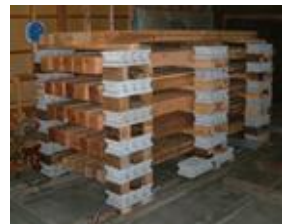
県産スギ材乾燥試験