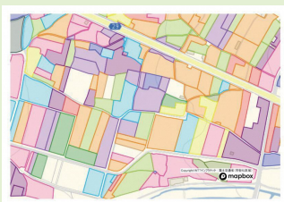
農業委員会サポートシステムを使用