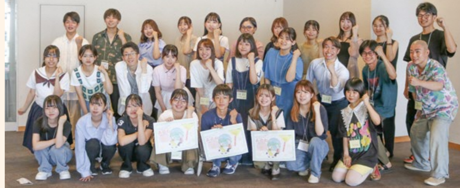
やまがた魅力発信アンバサダー第1回交流会の様子

県では、若者の県内定着と回帰の促進に向けて、若者のニーズを把握し、若者による魅力の発信や県内への就職の支援などの取組みを行っています。