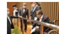
身障者用傍聴スペース実地調査