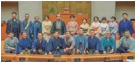
着物姿で本県の伝統産業をPR

令和6年度一般会計予算案については、3月14日、知事から「さくらんぼを核とした県産フルーツ情報発信事業費」の事業内容を見直すため撤回したい旨の申し出があり、同月15日の本会議で承認しました。その後、同事業を除いた予算案が再提出され、全会一致で可決しました。