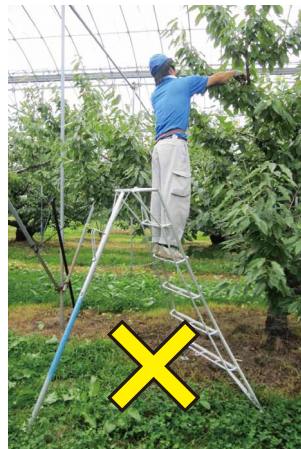
昇降面に背を向けて作業しない