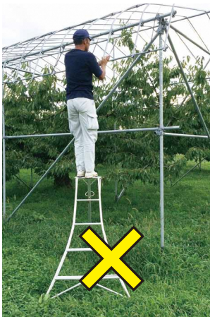
天板(最上段)では作業しない