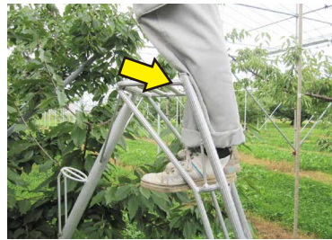
脛や腿を脚立に当てる