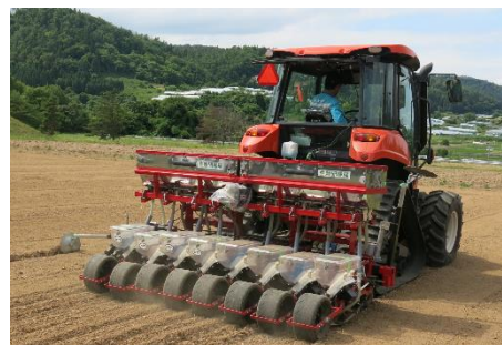
高速・高精度播種が可能な大豆播種機

そこで、大規模経営体が抱える様々な課題を解決する要素技術を組み立て、実証を行います。水田転換畑の復田手法や高速耕起・整地作業、高速・高精度播種機、小麦の高収益作付体系等、大規模経営体が活用できる要素技術を組み合わせることで、効率的な作業技術体系を確立し、生産性と収益性の向上を図ります。