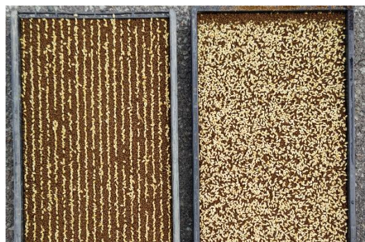
専用播種機による高精度な疎播（左）

それらへの対応のひとつとして、「はえぬき」の業務用米用途を対象に疎播・疎植を基盤技術として、高精度な播種技術、スマート農機による高精度移植、コーティング肥料を使用しない一発全量基肥施肥を組み合わせ、省力・多収栽培技術体系の確立を目指していきます。