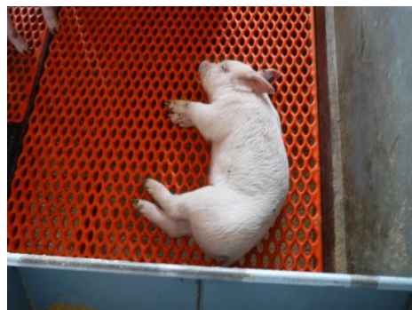
豚レンサ球菌症を発症した離乳子豚

離乳子豚の主要な死亡原因であり、慢性化して敗血症や関節炎など様々な症状を示すことに加えて人獣共通感染症としても重要な豚レンサ球菌症に対して、省力的かつ効果的なワクチネーション技術を確立します。