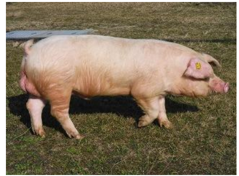
改良型ランドレース種豚