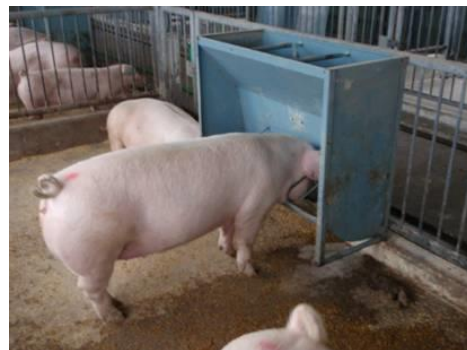
給与試験の実施状況

飼料自給率の向上と飼料費の低減を図るため、県産飼料原料の積極的な活用を目的とした技術開発を行うとともに、これらの飼料が肉質等に及ぼす効果について解明します。